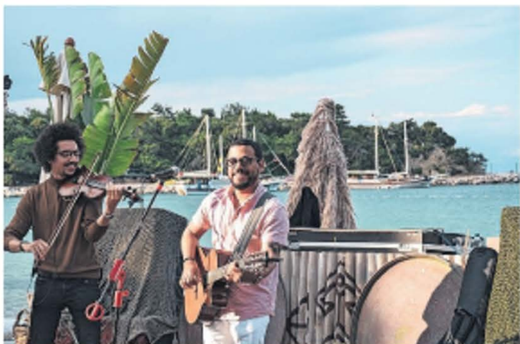
Twee Turkse mannen verzorgen de soundtrack bij Beachclub Qualista in Kemer.