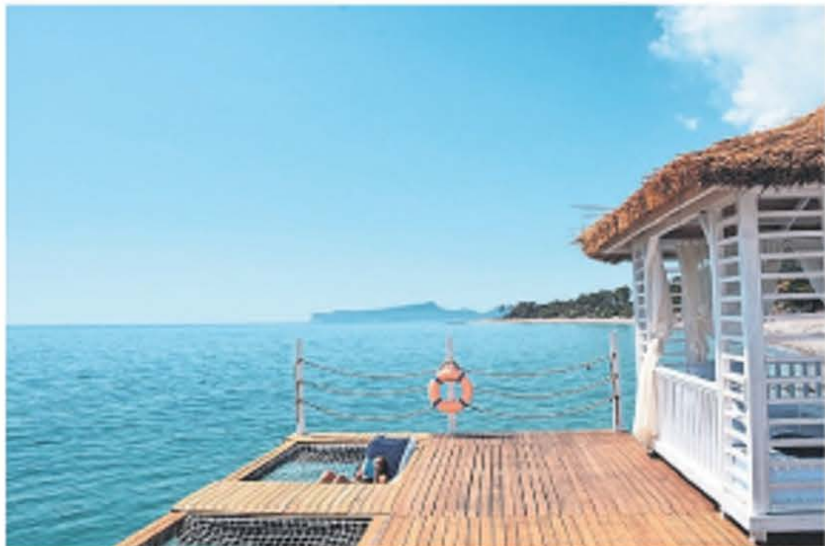
Uitien ontspannen doe je in een cabana op de pier van het Corendon Playa Kemer-resort.