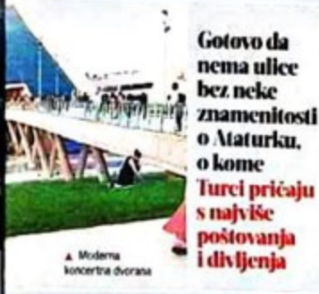
A. Moderna koncertna dvorana

A ono što u Istanbulu bele kula Galata, to je ovde simbol Ankare - Atakula. Moderni toranj, prvi put