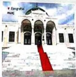
V. Etnografski muzej

Gotovo da nema ulice bez neke znamenitosti o Atatürku, o kome Turci pričaju s najviše poštovanja i divljenja