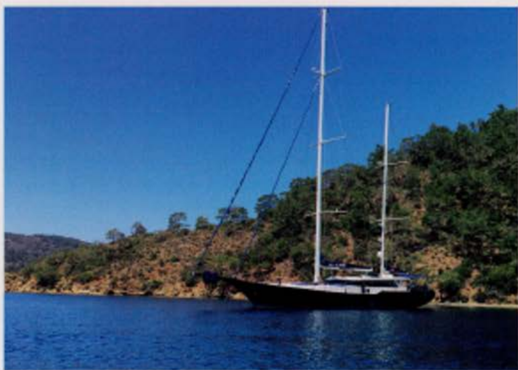
▲ Met de Perla del Mare verkennen we de baai van Göcek.