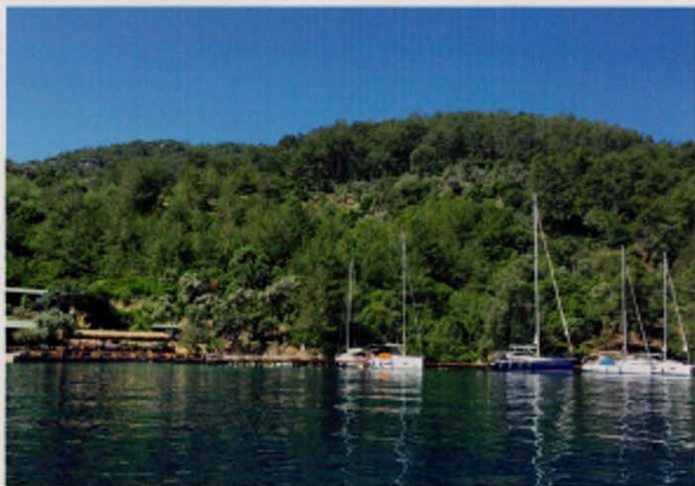
▲ Een van de vele typische baaien aan de Turquoise Kust.