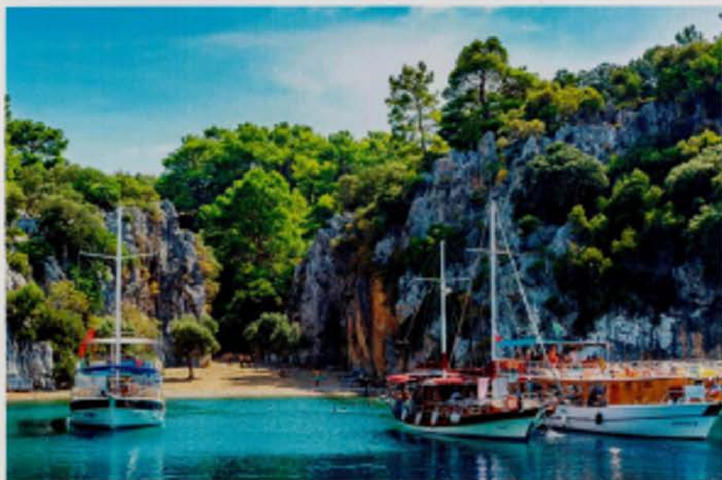
▲ Sinds 1988 geniet de Caretta Caretta-zeeschildpad of de onechte karetschildpad een beschermde status.