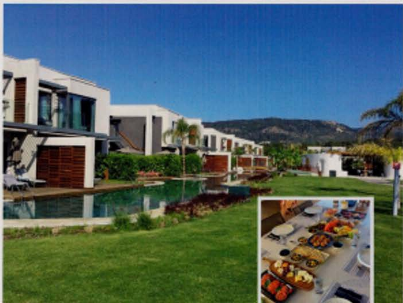
▲► De paradijslijk uitgebouwde resorts zijn indrukwekkend.

Tijdens onze reis gaat de Perla del Mare tweemaal voor anker, waarna we met een RIB op ontdekkings-tocht gaan. Behalve de natuurlijke schoonheid, het uitzicht op de omliggende bergen en het uiterst heldere water trekt ook de eenvoudige, maar belangrijke infrastructuur die de Turkse autoriteiten ten behoeve van het watertoerisme rond de baai hebben uitgebouwd onze aandacht. Vrijwel achter elke bacht ontdekken we nieuwe ligplaatsen. Vrijwel dagelijks komt een ophaaldienst ze leegmaken. Langs de oevers zien we talrijke discreet geplaatste aanlegpunten waar restafval kan achtergelaten worden. Wilde varkens op de oever weten anders maar al te goed de containers met restafval te vinden, waardoor ze het als zwerfvuil zouden kunnen verspreiden. In de baai heerst een strikt milieubeleid, met toezicht, om te voorkomen dat afval in zee terechtkomt of dat boten worden vastgemaakt aan natuurlijke elementen, zoals bomen en rotsen.