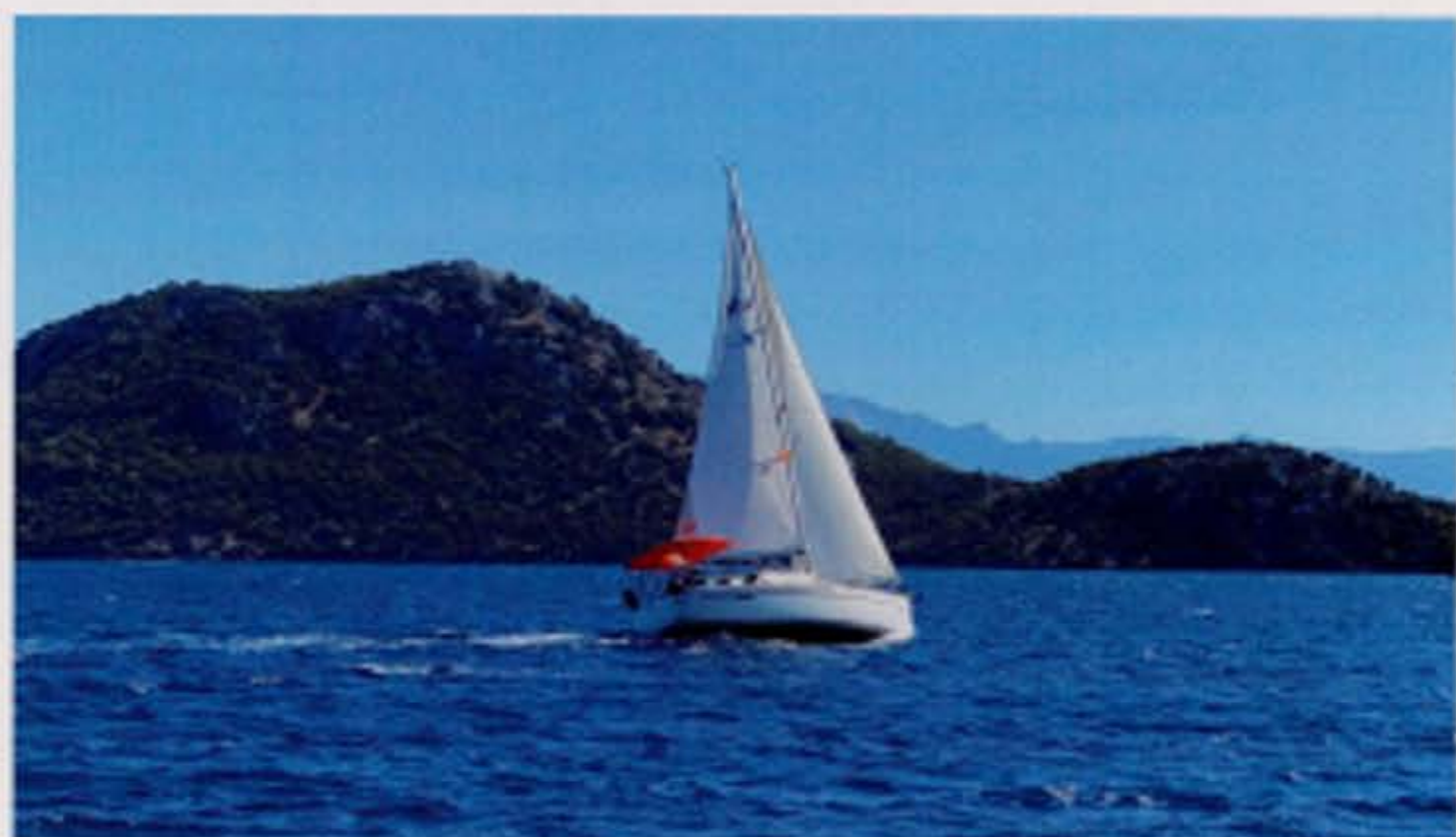
▲ Een van de zeiljachten in het aanbod van B&B Yachting in actie. Er zijn doorgaans gunstige zeilwinden in de Golf van Göcek of Fethiye.

ten en lekkere Turkse wijn, ervaren wij ons verblijf op en langs het water als een grandioos culinair festijn. Verslaggeving daarover hoort niet echt thuis in dit magazine, maar ook dat vormde naar onze bescheiden mening, ongetwijfeld het tikkeltje meer dat van Göcek en ruime omgeving een paradijs maakt voor de actieve watersporter.