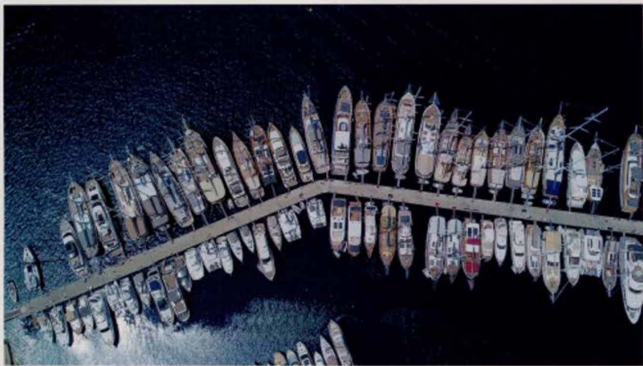
▲ Niet minder dan 48 jachten en superjachten liggen wer dagen aangemeerd in Göcek voor de TYBA Yacht Charter Show.