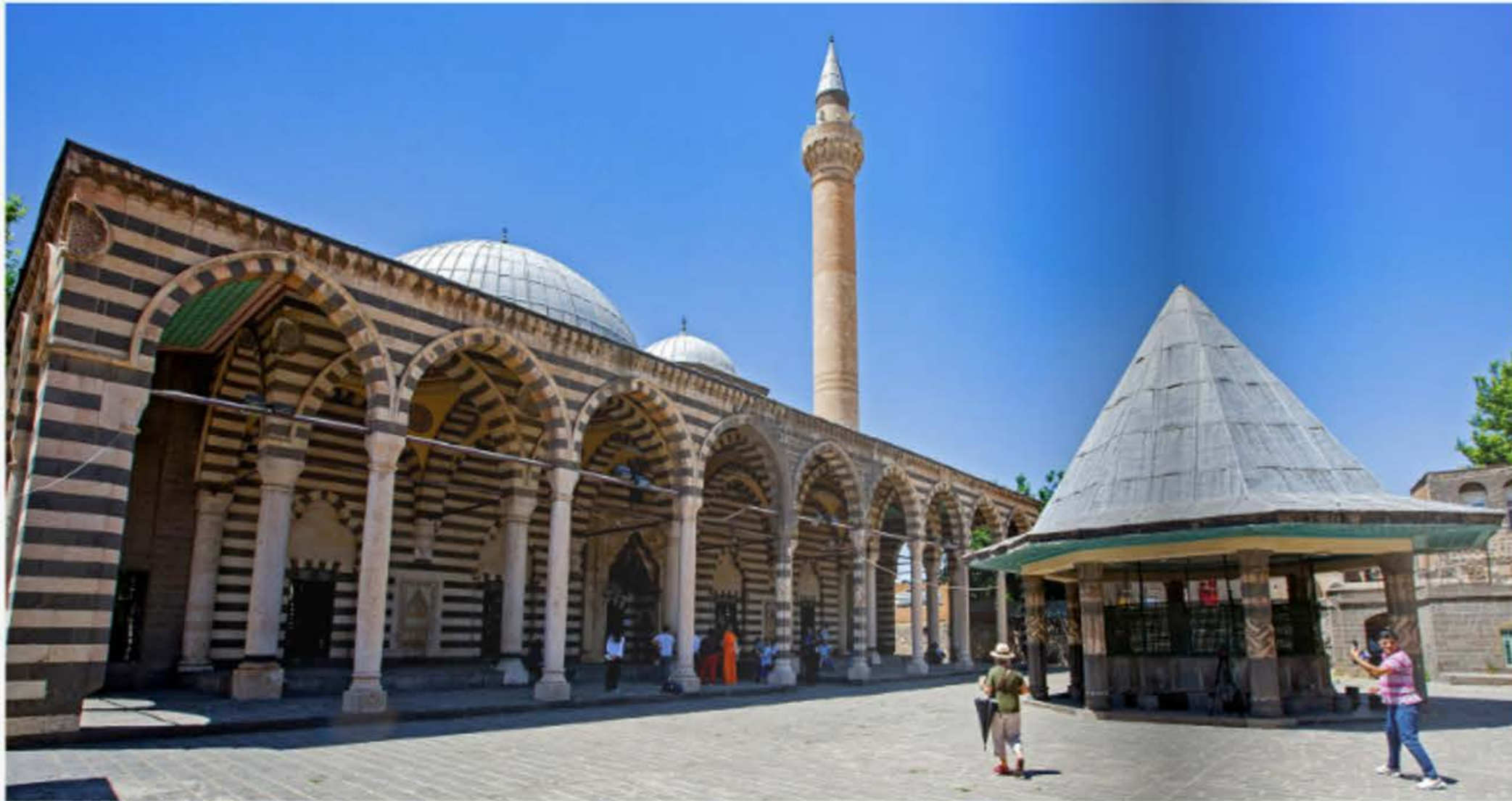
Gran Mezquita de Diyarbakir | Great Mosque of Diyarbakir

Todo viaje entraña unas expectativas y para los que, sin ser expertos, si somos amantes de la historia como fuente de conocimiento, llegar a esta región turca deslupa el jarrón de las enseñanzas.