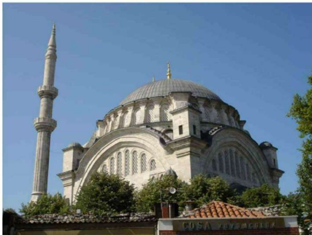
La mosquée Nuruosmaniye

L'ancienne basilique Sainte-Sophie, fondée par l'empereur Constantin en 325 fut achevée en 537 sous Justinien. Sa reconversion en mosquée par le sultan Mehmet II moyennant l'ajout de quatre minarets sauva cet admirable joyau de la chrétienté de la destruction.