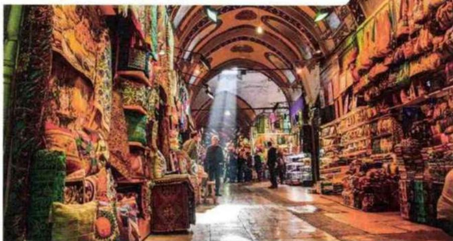
Le Grand Bazar est célèbre pour son architecture traditionnelle ottomane, avec ses dômes, ses coupôles et ses allées enchevêtrées. L'atmosphère animée du marché, ses bruits, ses couleurs et ses odeurs en font un lieu unique et enchanteur.

de produits locaux authentiques. Les commerçants, véritables maîtres de l'art de la négociation, accueillent les visiteurs avec chaleur et hospitalité, prêts à les guider à travers ce dédale de boutiques. Le Grand Bazar est également un lieu où les cultures se rencontrent. En effet, il attire des visiteurs du monde entier, créant ainsi un véritable melting-pot culturel. Les langues s'entremêlent, les odeurs envoûtantes se mélangent et les sourires se partagent, créant une atmosphère unique d'échange et